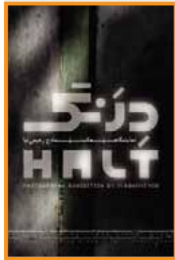
درنگ مادح رحیمی نیا گالری متن اصفهان ۱۳ آذر / ۱۶ تا ۲۰