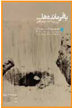
باقیمانده‌ها زینب ثقفی گالری آرت‌شیراز ۱۱ آذر / ۱۶ تا ۲۱