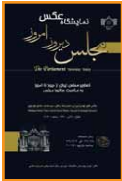
مجلس، دیروز، امروز نمایشگاه گروهی عکس نگارخانه مرکز استاد مجلس ۲۲ آذر / ۹ الی ۱۷