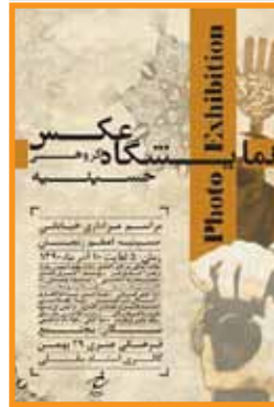
حسینیه نمایشگاه گروهی عکس نگارخانه استادمقبلی تبریز ۱۰ آذر / ۱۰ تا ۱۸