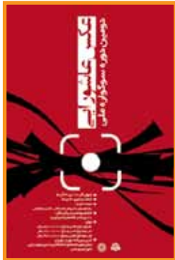
سوگواره عکس عاشورایی دانشگاه شهید رجایی آر آد با رویکرد عاشورایی ارسال تا: ۳۰ آذرماه ۱۳۹۰