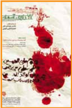
سوگواره ملی ۷۲ راوی آسمان حوزه هنری استان خراسان جنوبی موضوعات پیرامون حماسه عاشورا ارسال تا: ۵ دی ماه ۱۳۹۰