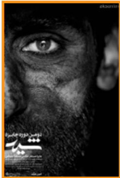
دومین جایزه شهید نمایشگاه گروهی عکس خانه هنر مندان / گالری نامی تا ۳۰ آذر / ۱۷ تا ۲۱